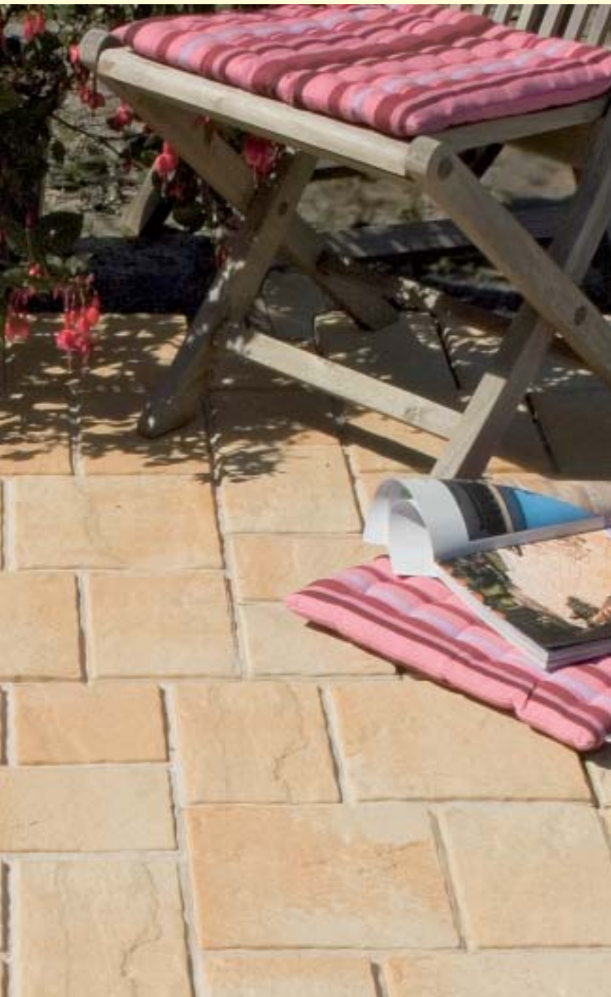
HACIENDA Plaza terra beige