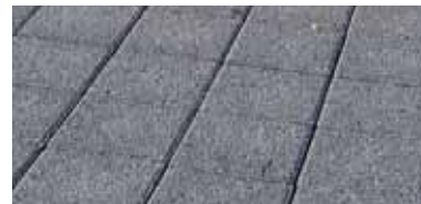
24 cm x 16 cm